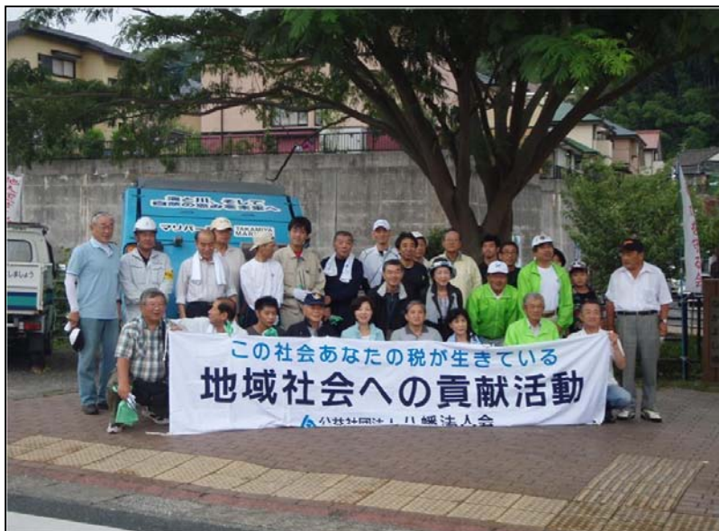
場所：八幡東区大蔵(大蔵川) 内容：八幡法人会の一員として参加 活動日：平成25年9月9日