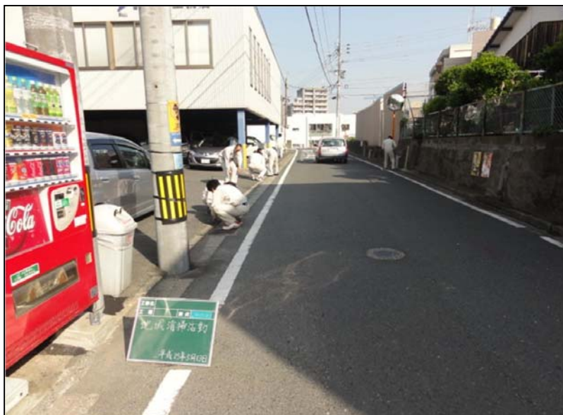
場所：八幡東区松尾町(会社周辺道路) 内容：地域貢献(社内ボランティア活動) 月1回実施(雨天中止) 活動日：平成25年5月13日