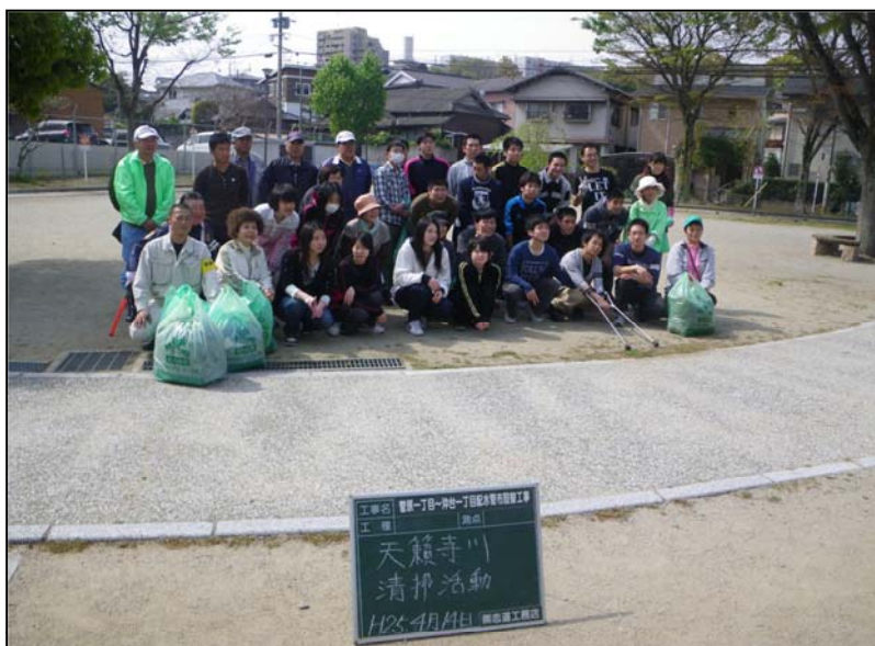
場所：戸畑区沖台(天籟寺川) 内容：天籟寺川清掃活動の一員として参加 活動日：平成25年4月14日